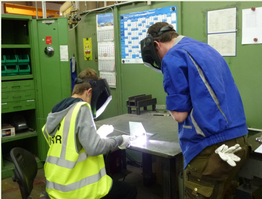
Schüler experimentieren in einem Betrieb während ihrer Erkundung